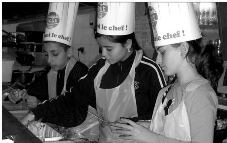
Les enfants de CM2 de l'école Bénézet au J'Go Toulouse