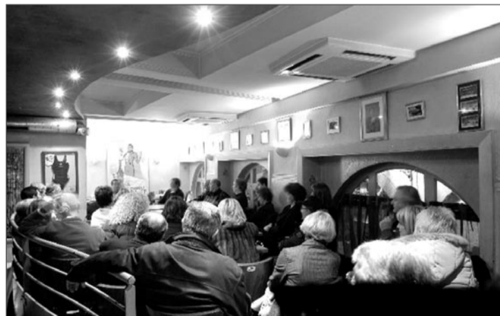
Soirée taurine à Toulouse

Vous avez des souvenirs de repas mémorables, des anecdotes amusantes vécues autour d'une table, vous avez envie de nous donner votre plan de table idéal ? Envoyez les nous à plaisir@lejgo.com . Les meilleurs souvenirs seront publiés.